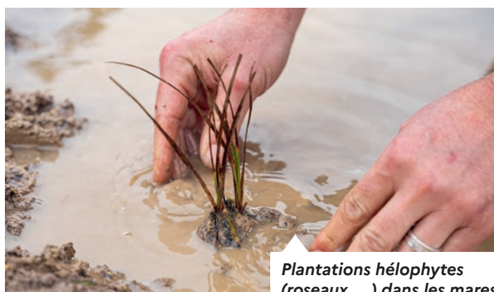
Plantations hélophytes (roseaux, ...) dans les mares