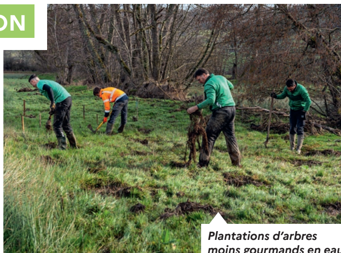
Plantations d'arbres moins gourmands en eau