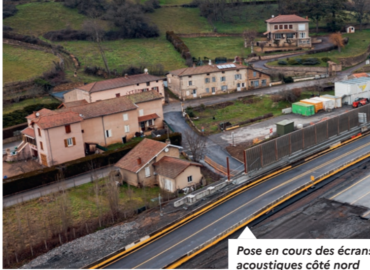
Pose en cours des écrans acoustiques côté nord

À l'issue de ce programme, la quasi totalité de la RCEA sera à 2x2 voies en Saône-et-Loire, alors que seulement 50% du linéaire l'était en 2014.