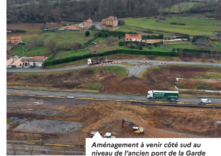
Aménagement à venir côté sud au niveau de l'ancien pont de la Garde