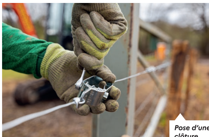
Pose d'une clôture