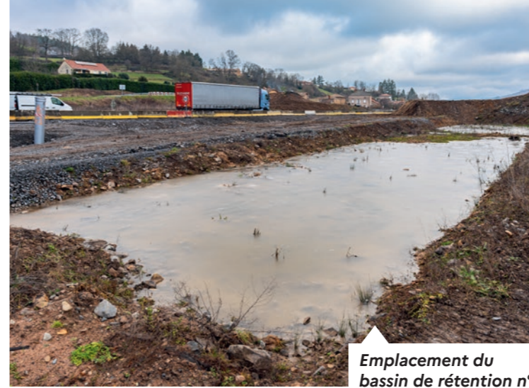
Emplacement du bassin de rétention n°4